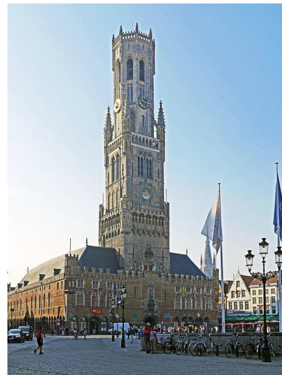
Belfried / Brügge