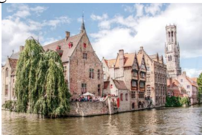
Brügge an der Gracht

Unser Quartier, das Hotel Ibis liegt direkt im Stadtzentrum.